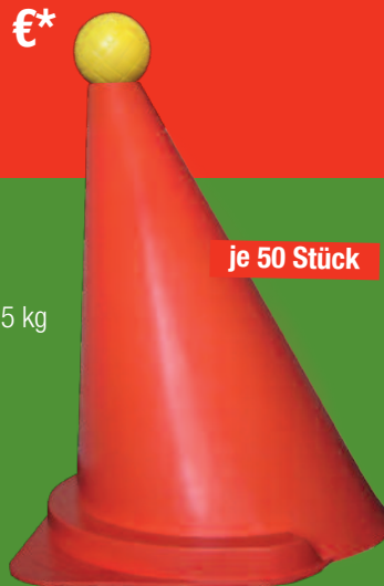
je 50 Stück

2 Rollen Absperrband - Flutterband / 2 rolls of streamer tape