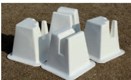
Dressurkegel PVC Dressage Letter PVC