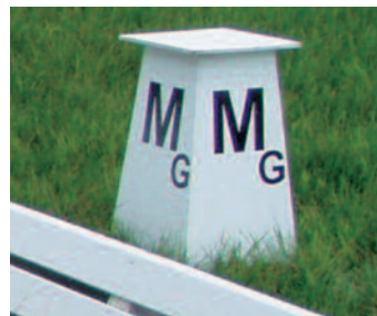
Dressurkegel Dressage cones

Art.-Nr / Order-No. 18212 Stück / piece 67,50 € *