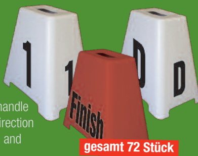
gesamt 72 Stück