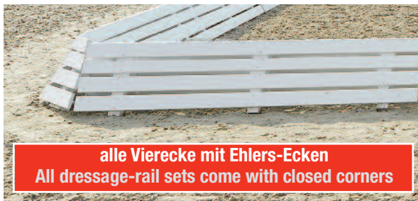
alle Vierecke mit Ehlers-Ecken All dressage-rail sets come with closed corners